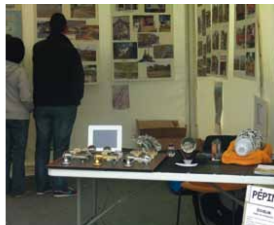
Le stand de Bréhat.