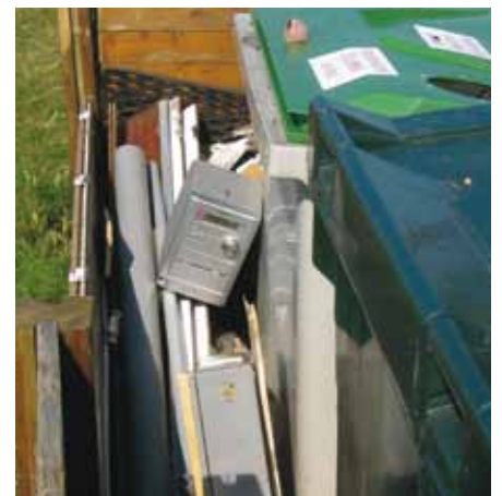
Un manque de civisme...