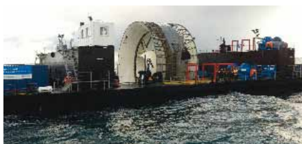
La barge apportant l'hydrolienne sur son lieu d'immersion.

Dans un délai d'une vingtaine d'années, le parc hydrolien national devrait comprendre environ 100 machines en production couvrant les besoins électriques de 100 000 foyers.