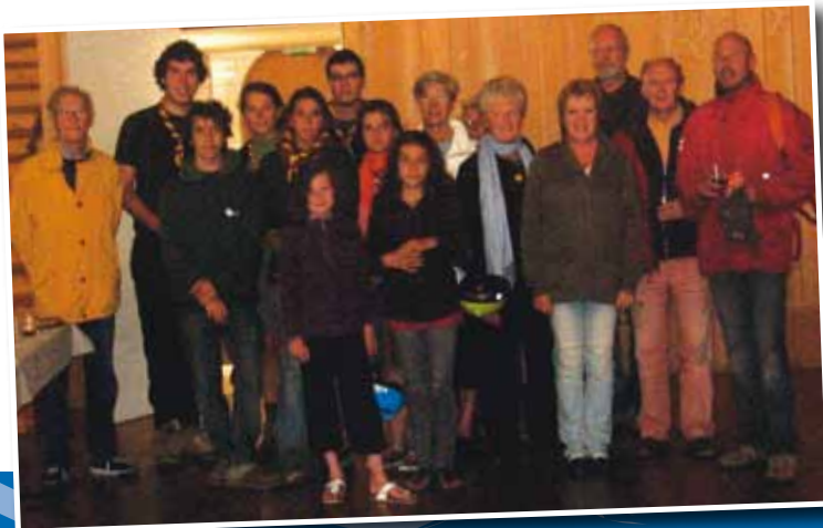
Les participants au nettoyage des grèves.

Pour montrer une nouvelle fois le manque de civisme de certains de nos concitoyens, voici une photo prise au tertre Briand.