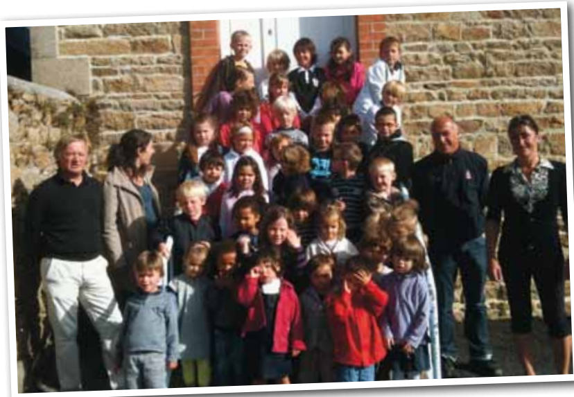
Les enfants, les enseignants, le maire et l'assistante maternelle.