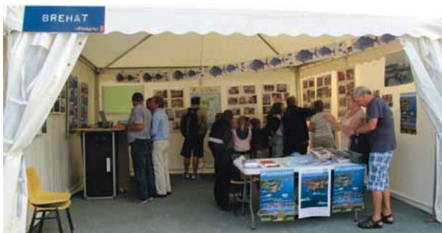
Le stand de Bréhat.