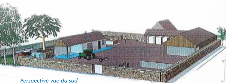
Perspective vue du sud.

Le permis de construire est actuellement en cours d'instruction auprès de la Direction départementale des territoires et de la mer (DDTM) et des Bâtiments de France (ABF). Ce projet peut être encore modifié en fonction des prescriptions émises par lesdites administrations de l'Etat.