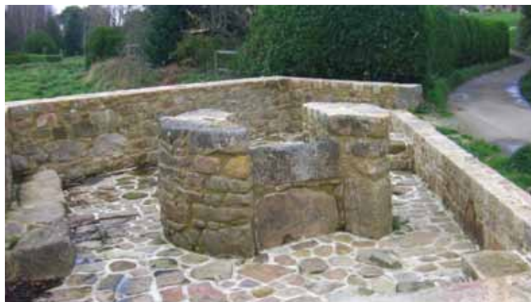
Puits du Gardeno.