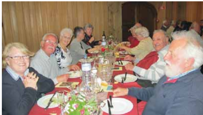
Le dîner du samedi soir.

La présence de Bréhatines en costume et coiffe (capot) traditionnels a été particulièrement remarquée et appréciée. L'après-midi du dimanche était libre et dès 9h45, la vedette ramenait nos visiteurs vers le continent. Trois jours de beau temps et de complicité partagée ! La prochaine fois, ce seront les Bréhatins qui se rendront en Alsace.