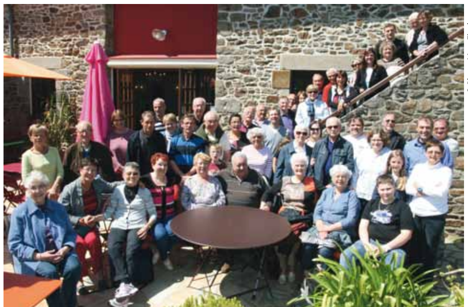
Alsaciens et Bretons lors de l'excursion.