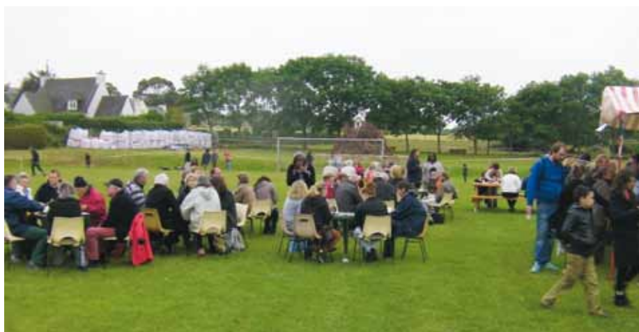
Feu de la Saint-Jean.

Parmi les nombreuses actions de l'Amicale Laïque, il faut citer le repas de début d'année, la chasse à l'œuf, les ventes de gâteaux, la kermesse de l'école, la vente de lampions, sa participation