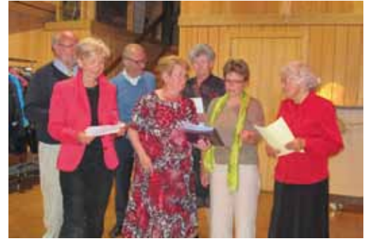
Les chanteurs lors du dîner.