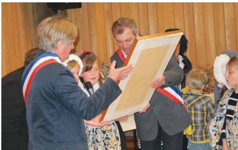
Lecture du serment de jumelage.