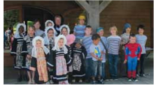
Les enfants ont participé aux cérémonies.

La présence de Bréhatines en costume et coiffe (capot) traditionnels a été particulièrement remarquée et appréciée. L'après-midi du dimanche était libre et dès 9h45, la vedette ramenait nos visiteurs vers le continent. Trois jours de beau temps et de complicité partagée ! La prochaine fois, ce seront les Bréhatins qui se rendront en Alsace.