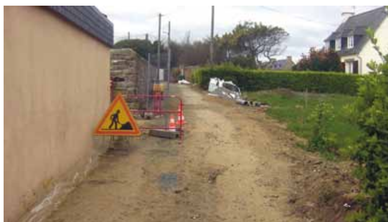
Route de Park ar Pellec.