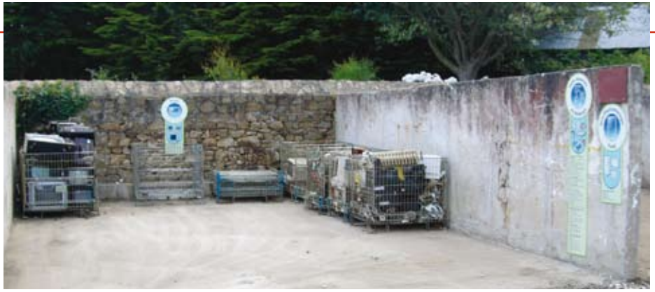
Box pour les D3E.

La déchèterie ne reçoit ni gravats, ni déchets verts, ni ordures ménagères. Pour les gravats vous pouvez appeler la mairie pour convenir d'un rendez-vous