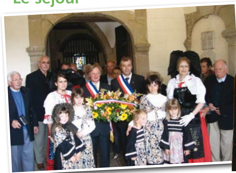
Le dépôt de gerbe au monument aux morts, sous le porche de l'église.