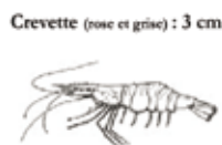
Crevette (rose et grise) : 3 cm