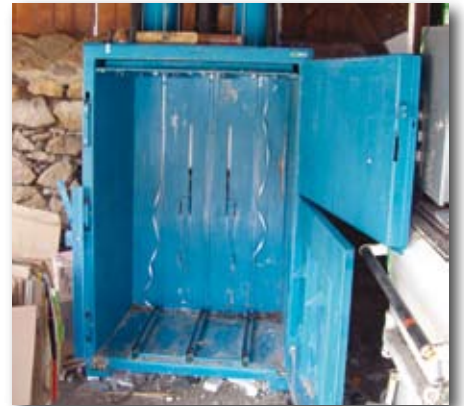
Presse à cartons.