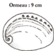
Ormeau : 9 cm

La mer est un espace tellement riche dans la diversité des espèces, elle est fragile. Il faut la préserver, la sauvegarder en ayant en tête ce que l'on peut y faire et surtout ce que l'on ne doit pas y faire. C'est notre avenir pour pouvoir encore pêcher demain.