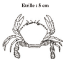
Etrille : 5 cm