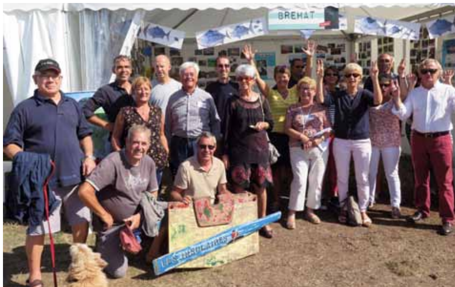
Une partie des participants devant le stand de Bréhat

Chaque île participante disposait d'une grande tente, genre barnum et faisait découvrir son « île » en mettant en avant ses habitants, leurs activités, à travers des photos, des livres, des produits locaux. C'est cela le village des îles et la découverte pour les nombreux visiteurs de