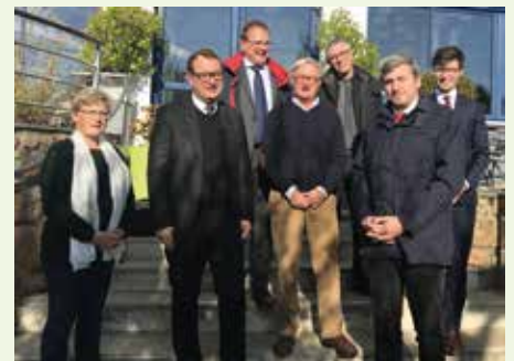
Le préfet, le maire, l'adjointe et une partie de la délégation préfectorale

La délégation s'est ensuite rendue à la déchetterie. Une attention particulière a été portée au traitement des déchets notamment des ordures ménagères à la suite de l'arrêt de la presse à balles le 14 août dernier. Le maire a exposé sa préoccupation face à ce problème et présenté l'organisation provisoire mise en place. Le maire a expliqué en détails l'articulation du projet d'aménagement d'un nouveau centre de transit pérenne proche de « Chicago » ce qui a retenu toute l'attention de nos invités. L'implantation exacte de la nouvelle structure et ses équipements ont été présentés à la délégation préfectorale qui a souligné la cohérence d'un projet ambitieux.