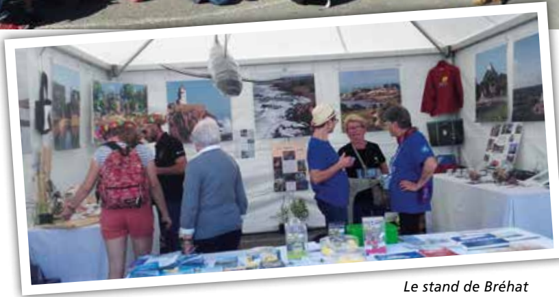
Le stand de Bréhat

L'an dernier, le festival Les insulaires s'était déroulé à Bréhat. A cette occasion, beaucoup de Bréhatins, résidents permanents ou secondaires, jeunes ou moins jeunes, l'avaient découvert et y avaient participé en tant que bénévoles et/ou en recevant chez eux d'autres insulaires. Cet événement avait permis à beaucoup d'entre eux de se découvrir et de nouer des liens.