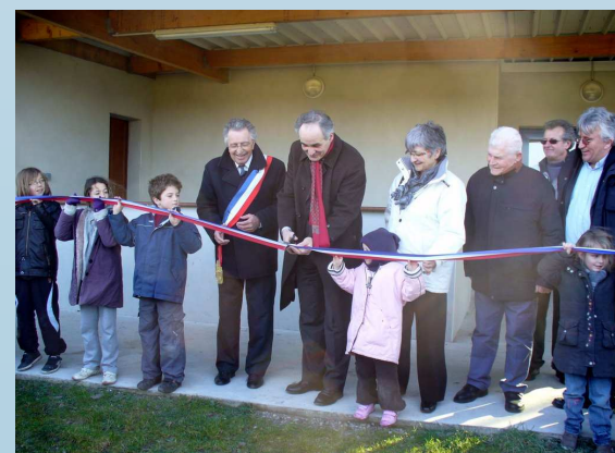
Inauguration salle des sports - Houat - fév. 2010

Lors de l'Assemblée, les élus des îles ont attiré l'attention sur les conséquences importantes que pourrait avoir pour les îles les projets de réforme des collectivités territoriales en cours de discussions : l'obligation d'être dans une Intercommunalité (et le « bonus » qui va avec) qui ne va pas de soi pour certaines îles, la disparition de la « clause de compétence générale » des autres collectivités (Région, Département) - qui interdirait ses financements particuliers, le risque d'éloignement des îles des futurs conseillers territoriaux, autant d'interrogations qui posent la question de la prise en compte de la situation particulière des petites îles côtières. A moins que ce ne soit l'occasion d'innover en leur accordant une attention spéciale pérenne, répondant à leur situation et leur contraintes particulières, également pérennes ! Non pas au nom d'un principe d'exception, mais simplement de celui de réalité et de l'égalité des citoyens.