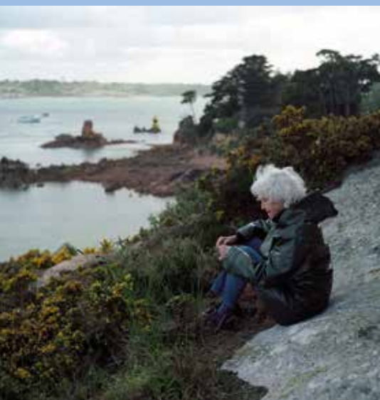
Dans les rochers où elle révisait Île de Bréhat

Peut-on, en trois pages, résumer toute une vie de résistance ? Il est évident que non, que cet article ne peut qu'effleurer très superficiellement ce parcours bouleversant... Évoquer quelques-uns des précieux messages qu'elle nous transmet.