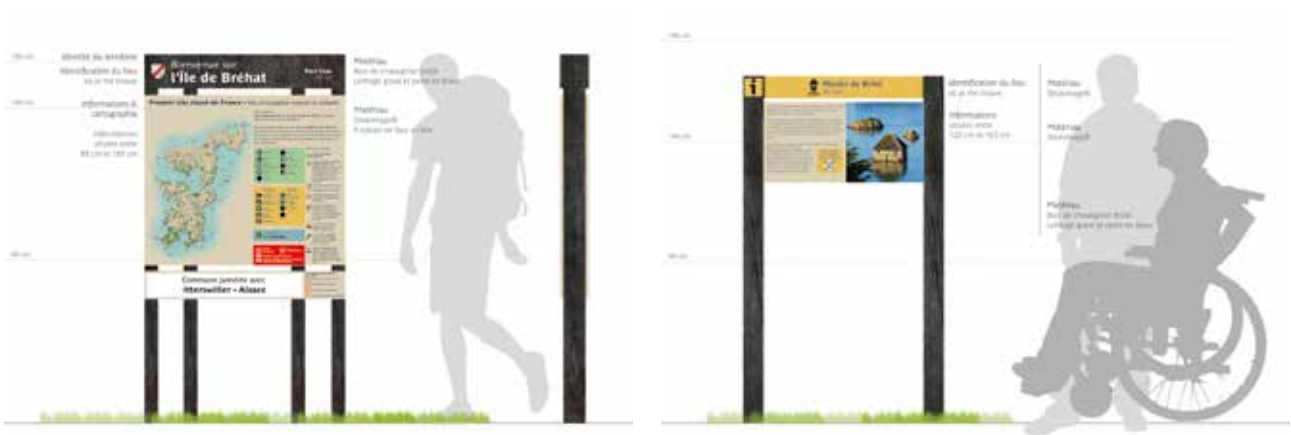
Exemple de RIS (Relais Information Services) et de panneau d'interprétation (NB : le contenu est présenté à titre indicatif)

L'information et la sensibilisation des visiteurs se feront par le biais de deux types de supports, toujours en châtaigner. Les informations générales telles que la vue d'ensemble du territoire, la localisation sur l'île via un logo « vous êtes ici » ainsi que le rappel des écogestes à adopter pour une visite responsable, seront rassemblés au sein des relais information services. Ces panneaux d'environ 1.80 mètre de hauteur et 1 mètre de largeur seront installés dans des points stratégiques. Ils seront complétés par des