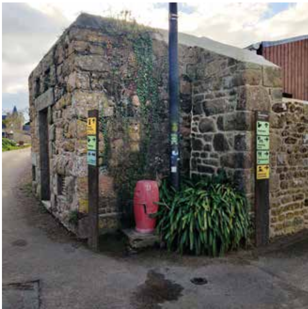
Exemple d'intégration des supports directionnels dans le paysage (nb : le contenu des supports - lieux et direction est présenté à titre indicatif).

Au niveau administratif, les permis d'aménager nécessaires pour l'implantation des panneaux en sites classés ou inscrits situés dans les zones Aer ou Ner du P.L.U. (zones naturelles ou agricoles remarquables et caractéristiques du littoral) sont en cours d'élaboration par la maîtrise d'œuvre chargée du projet. Par la suite ? il faudra donc recruter l'entreprise chargée de la réalisation et de la pose des éléments du projet par le biais d'un marché public. Même si le plus visible est donc sur le point d'être achevé, le dossier est loin d'être terminé pour s'assurer d'une pose effective au début de saison 2024 !