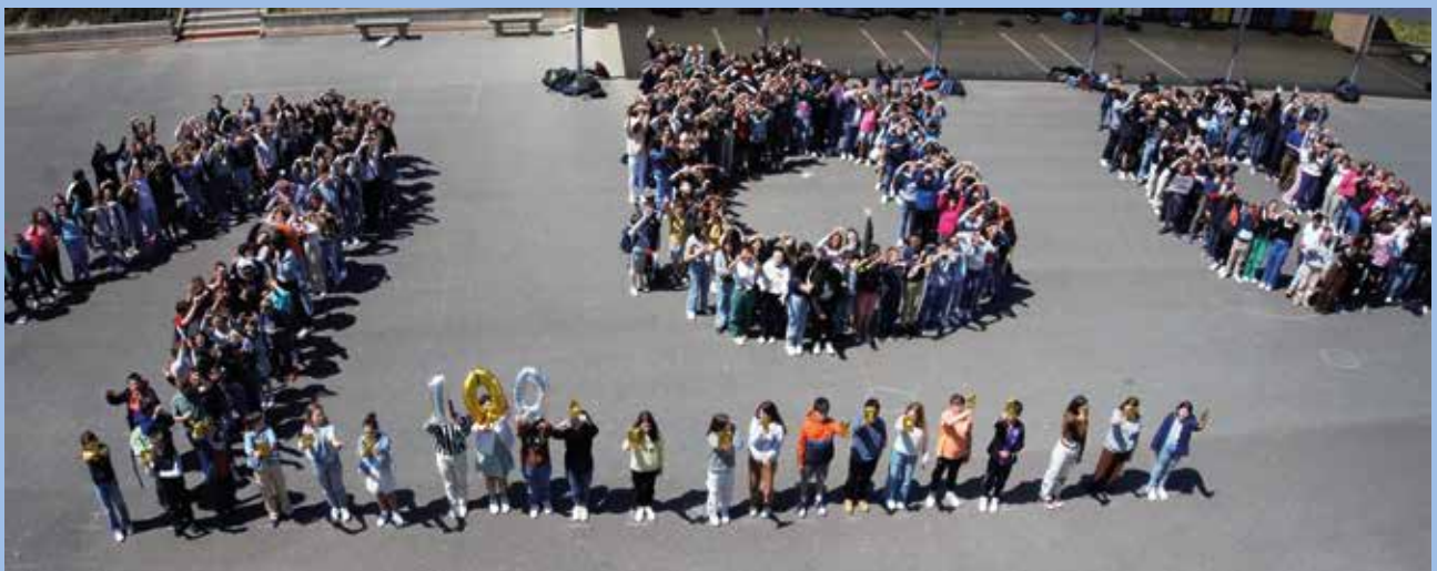
Les collégiens du collège Chombart de Lauwe