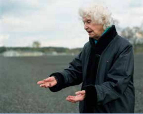
«Le pire. La mort des enfants.» Ravensbrück, Allemagne

nourrissons seront placés à la Kinderzimmer, et seule une trentaine de bébés survivra.