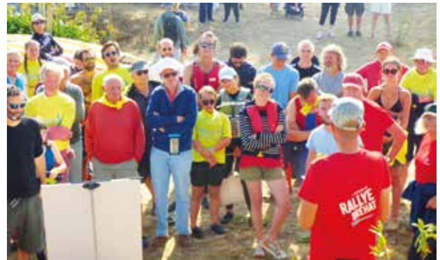
Briefing d'avant départ

Une réussite pour cette collaboration entre la mairie, les membres de l'A.P.P.G. (Association des Porteurs de Parts du Guerzido) et le centre nautique de Bréhat !